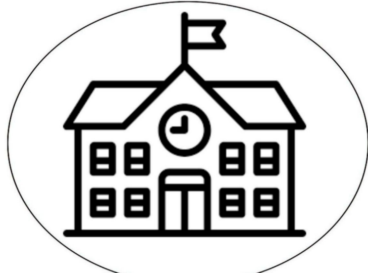
po powrocie ze szkoły