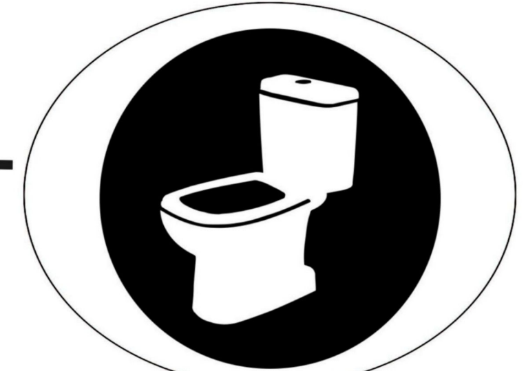
po skorzystaniu z toalety