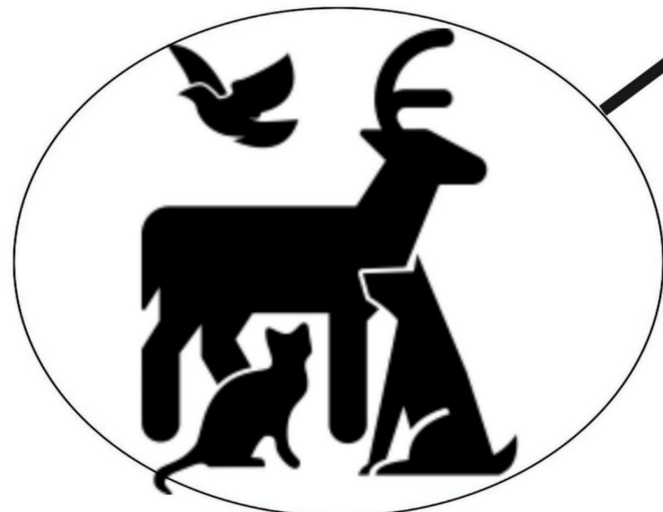
po zabawie ze zwierzętami