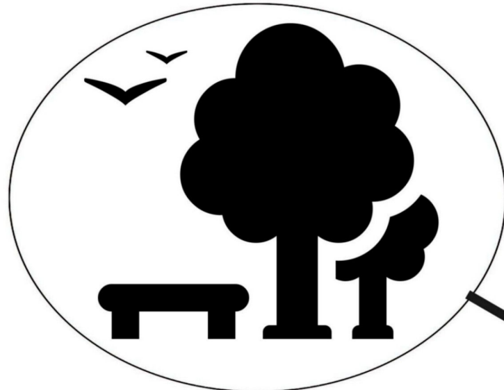
po powrocie ze spaceru